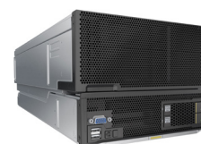
半宽异构计算节点