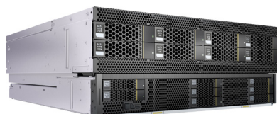
全宽异构计算节点

FusionServer Pro G5500具有高密的异构计算能力，支持丰富的异构拓扑配置和一键切换，支持CPU和异构计算技术的长期演进。FusionServer Pro G5500适合为AI、HPC、智能云、视频分析和数据库等应用加速，是面向数据中心大规模部署的最佳异构计算平台。